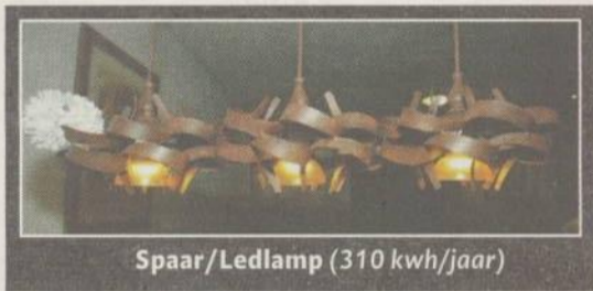
Spaar/Ledlamp (310 kwh/jaar)