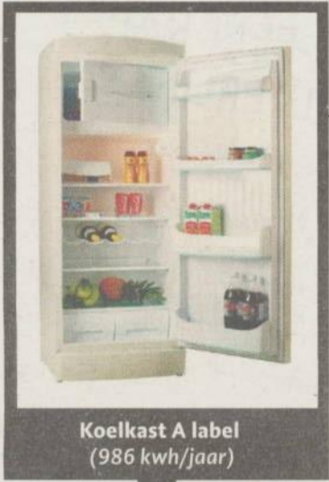
Koelkast A label (986 kwh/jaar)