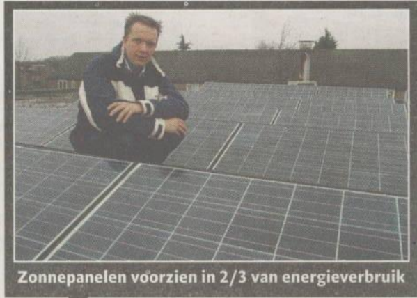
Zonnepanelen voorzien in 2/3 van energieverbruik