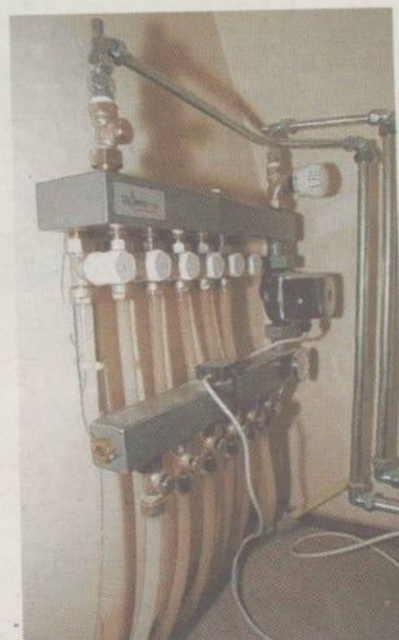
De slangen voor de vloerverwarming gaan de grond in.