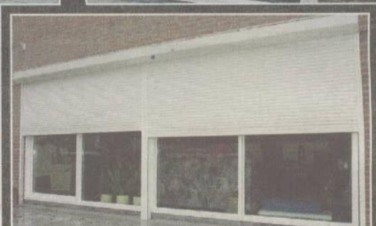
Rolluiken i.p.v. airco (3599 kwh/jaar)