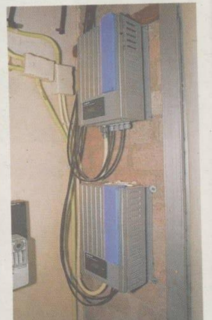
Een electriciteitsmeter die terugtelt.